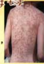
▲梅毒二期皮膚紅疹